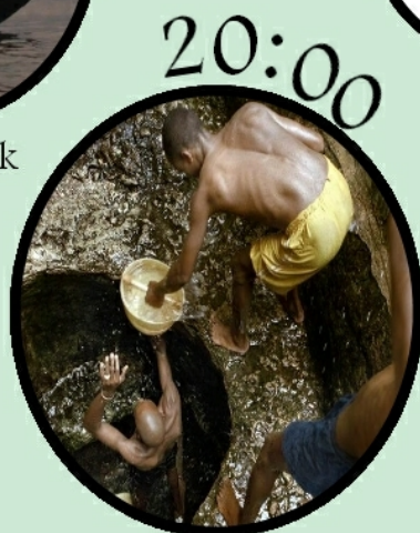
Studna - Hlas z Etiopie